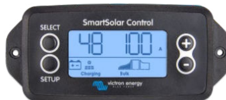
SmartSolar einsteckbares Display