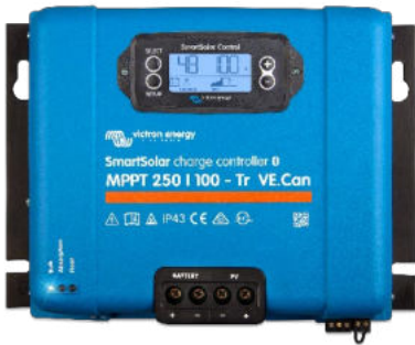
SmartSolar-Lade-Regler MPPT 250/100-Tr VE.Can mit Option einsteckbares Display