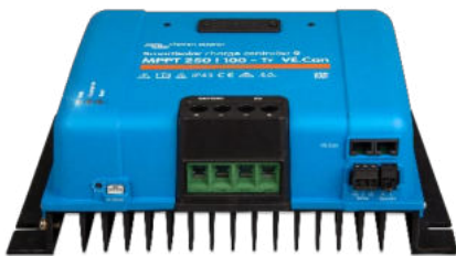
SmartSolar-Lade-Regler MPPT 250/100-Tr VE.Can ohne Display