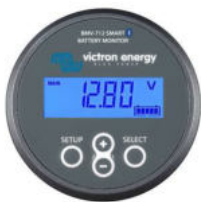
Bluetooth-Sensorik: BMV-712 Smart Batteriewächter