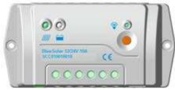
BlueSolar PWM-Pro 10 A