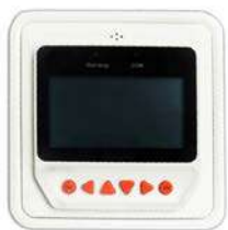
BlueSolar Pro Fernbedienungspaneel

Weitere Einzelheiten dazu im Handbuch des Fernbedienungspaneels