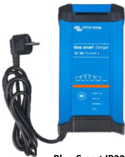
Blue Smart IP22 12/30 (3)