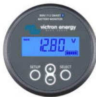
BMV-712 Smart Battery Monitor