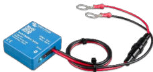
Smart Battery Sense Ermöglicht temperatur- und spannungskompensiertes Laden.